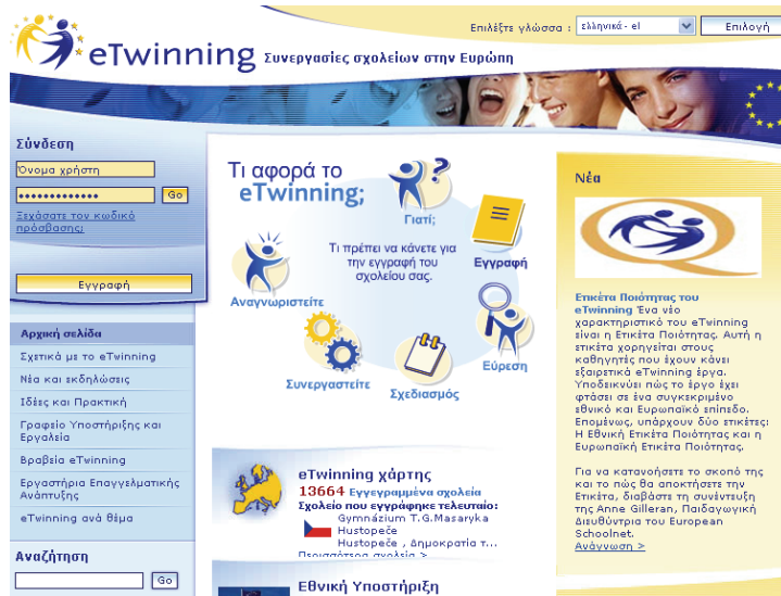
Σχήμα 2. Κεντρική σελίδα του eTwinning

Τέλος αναφέρονται ως επιπλέον επιτυχημένες προσπάθειες τόσο η δικτυακή πύλη ΙΣΟΚΡΑΤΗΣ (Σχήμα 3), όσο και ο κόμβος e-ομογένεια. Η δικτυακή Πύλη της Παιδείας Ομογενών και Διαπολιτισμικής Εκπαίδευσης, ο ΙΣΟΚΡΑΤΗΣ (www.Isocrates.gr) αποτελεί ένα σημαντικότατο έργο με πλούσια προστιθέμενη διαπολιτισμική αξία. Ο κόμβος παρέχει πληροφόρηση για την ελληνόγλωσση εκπαίδευση και τις ελληνικές σπουδές στο εξωτερικό, για την διαπολιτισμική εκπαίδευση, εκπαιδευτικό υλικό, αλλά και υποστηρίζει σχεδιαστικά και πραγματικά τις λειτουργίες δημιουργίας ανθρώπινου δικτύου τόσο μεταξύ των στελεχών του ΥΠΕΠΘ στην Ελλάδα και στο εξωτερικό όσο και μεταξύ των ομογενειακών κοινοτήτων των εκπαιδευτικών, των μαθητών και των σχολείων.