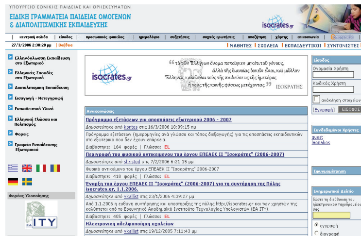
Σχήμα 3. Κεντρική σελίδα της δικτυακής πύλης ΙΣΟΚΡΑΤΗΣ

Τέλος αναφέρονται ως επιπλέον επιτυχημένες προσπάθειες τόσο η δικτυακή πύλη ΙΣΟΚΡΑΤΗΣ (Σχήμα 3), όσο και ο κόμβος e-ομογένεια. Η δικτυακή Πύλη της Παιδείας Ομογενών και Διαπολιτισμικής Εκπαίδευσης, ο ΙΣΟΚΡΑΤΗΣ (www.Isocrates.gr) αποτελεί ένα σημαντικότατο έργο με πλούσια προστιθέμενη διαπολιτισμική αξία. Ο κόμβος παρέχει πληροφόρηση για την ελληνόγλωσση εκπαίδευση και τις ελληνικές σπουδές στο εξωτερικό, για την διαπολιτισμική εκπαίδευση, εκπαιδευτικό υλικό, αλλά και υποστηρίζει σχεδιαστικά και πραγματικά τις λειτουργίες δημιουργίας ανθρώπινου δικτύου τόσο μεταξύ των στελεχών του ΥΠΕΠΘ στην Ελλάδα και στο εξωτερικό όσο και μεταξύ των ομογενειακών κοινοτήτων των εκπαιδευτικών, των μαθητών και των σχολείων.