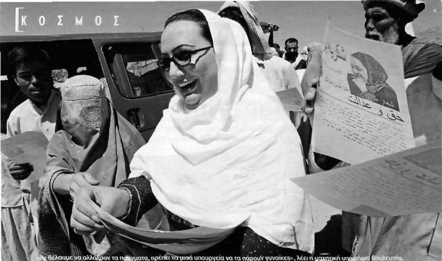
«Αν θέλουμε να αλλάξουν τα πράγματα, πρέπει τα μισά υπουργεία να τα πάρουν γυναίκες», λέει η μαχητική υπουργός Βουλευτής.