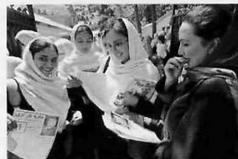
Φεμινίστρια στο Αφγανιστάν. Πριν από την πτώση των Ταλιμπάν, θα ακουγόταν σαν ανέκδοτο.

κές του περασμένου Οκτωβρίου. Ο ΟΗΕ και οργανώσεις όπως η Human Rights Watch έχουν εκφράσει φόβους για την ομαλή διεξαγωγή τους – ειδικά για την ασφάλεια των γυναικών υποψηφίων.