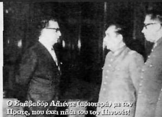
Ο Σαίβαδορ Αλιέντε (αριστερά) με την Πρατς, που έχει πηλάι του τον Πινοσέτ!