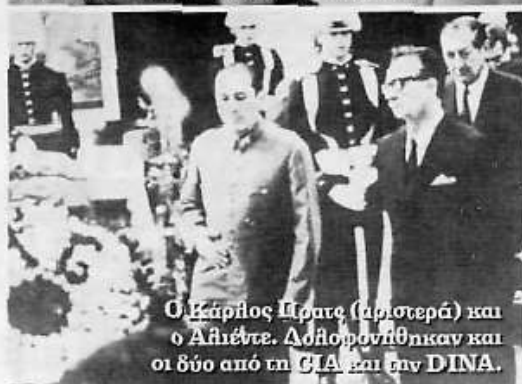
Ο Κάρλος Πρατς (αριστερά) και ο Αλιέντε. Δολοφονήθηκαν και οι δύο από τη CIA και την DINA.

Από τη μέρα που τον σκότωσαν, εμείς ορκιστήκαμε ότι έπρεπε να λάμψει η αλήθεια, όχι μόνο για την οικογένειά μας, αλλά για τη Χιλή και τη δημοκρατία. Ψάχναμε μέρες και νύχτες τι ακριβώς έγινε. Ακολούθησε και η δικτατορία στην Αργεντινή. Κι όλα έγιναν δυσκολότερα. Πώς να συγκεντρώσεις πληροφορίες; Δέκα χρόνια αργότερα, με στοιχεία πια, ήμασταν σε θέση να ξεκινήσουμε μια εκστρατεία ολόκληρη για να λάμψει η αλήθεια».