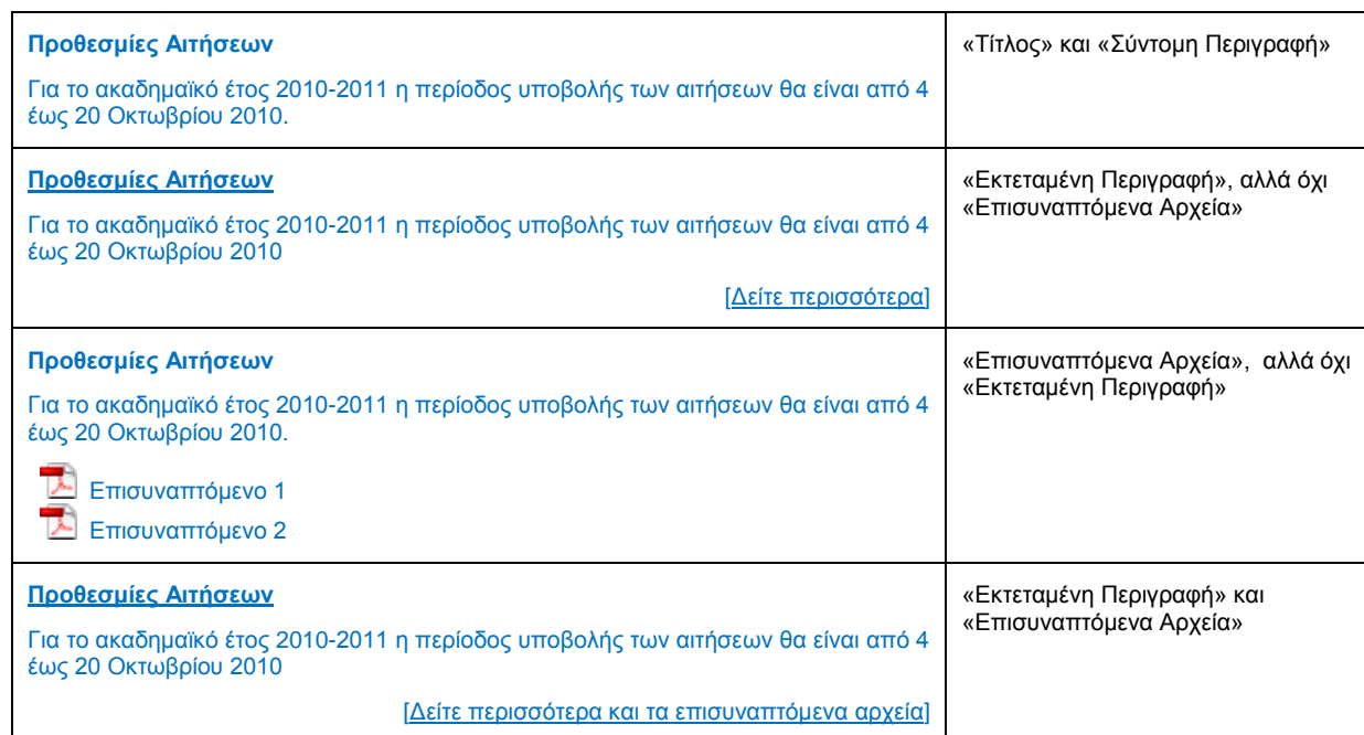
Σχέδιο 1.2: Τρόπος εμφάνισης άρθρων στη Διαδικτυακή Πύλη

Οι ίδιες ακριβώς ρυθμίσεις εμφάνισης, θα ισχύουν και στην περίπτωση που το άρθρο έχει τοποθετηθεί σε μία ιστοσελίδα με ένα άρθρο (απλά, εκεί δεν θα υπάρχουν άλλα άρθρα και δεν έχει ιδιαίτερο νόημα να δηλωθεί και συνοπτική και εκτεταμένη περιγραφή).