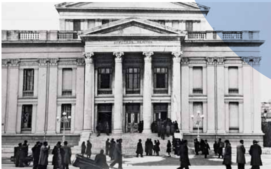
Η πρόσοψη του θεάτρου, στη συμβολή της Λεωφόρου Γεωργίου Α' και της οδού Κολοκοτρώνη

για πολιτικούς κυρίως λόγους η κυρίαρχη γλώσσα της εξουσίας και θα αγκαλιάσει από την αρχιτεκτονική –την «τέχνη των τεχνών» σύμφωνα με την άποψη της εποχής– τη γλυπτική, τη ζωγραφική, την επίσημη γλώσσα (την καθαρεύουσα), ακόμη και τη μόδα που αφορούσε τόσο στις γυναίκες όσο και στους άντρες.