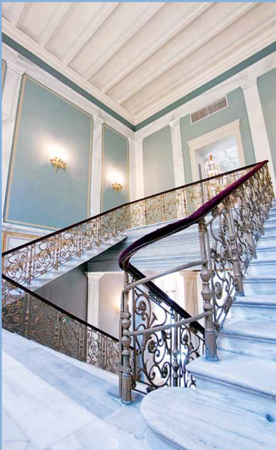
Η κεντρική σκάλα του θεάτρου, όπως είναι σήμερα.