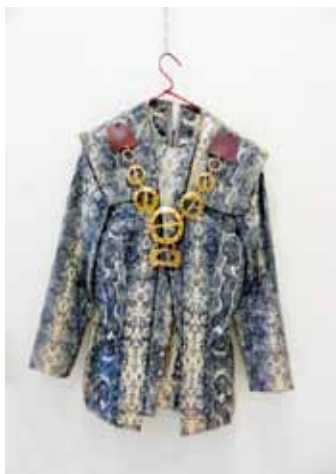
Παράσταση: «Βασιλιάς Ληρ» του Σαίξπηρ Σκηνοθεσία: Μ. Κατράκης Δημοτικό Θέατρο Πειραιά 1971-2

Τα τεκμήρια προέρχονται από τη συλλογή Μάνου Κατράκη, δωρεά της συζύγου του καλλιτέχνη Λίντας Άλμα (Ελένη Μαλιούφα) στη Δημοτική Πινακοθήκη Πειραιά.