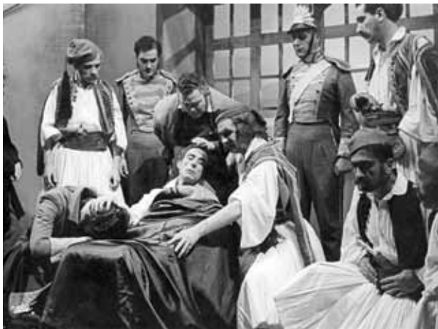
Παράσταση: «Λόρδος Βύρων» του Αλέκου Μ. Λιδωρίκη Σκηνοθεσία: Μάνου Κατράκη Δημοτικό Θέατρο Πειραιά 1955-56