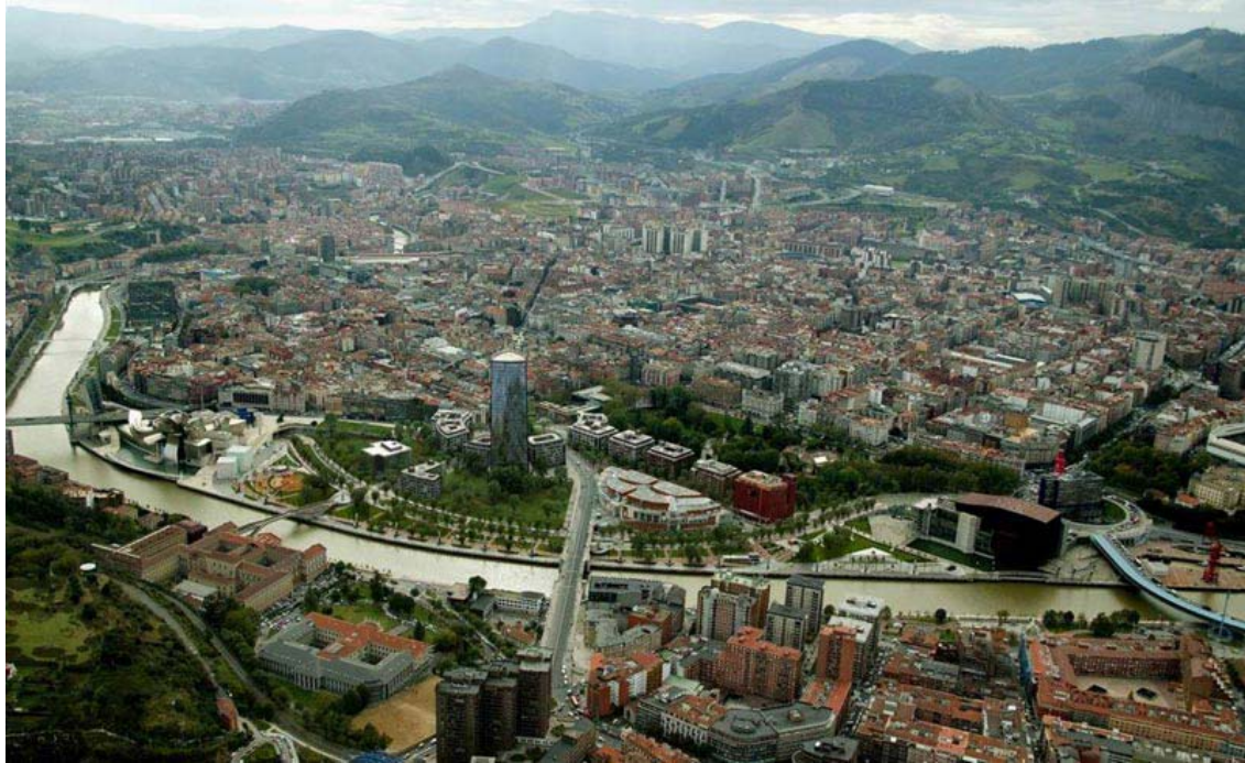
Σχ. 9. Μπιλμπάο, Ισπανία. Η περιοχή Abandoibarra που αναπτύχθηκε ως επίκεντρο πολιτισμού και ελεύθερου χρόνου..