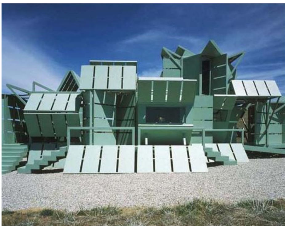
Σχ 11: Μοντέλο μετακινούμενης προκατασκευασμένης κατοικίας η οποία είναι αυτόνομη σε ενέργεια και συνδέσεις με τηλεπικοινωνιακά δίκτυα, και μπορεί να διαλύεται, να μεταφέρεται και να ξανα-συναρμολογείται σε άλλο τόπο.