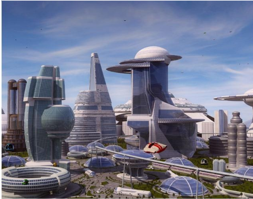
Σχ 12: Εικόνες της μελλοντικής ψηφιακής πόλης.