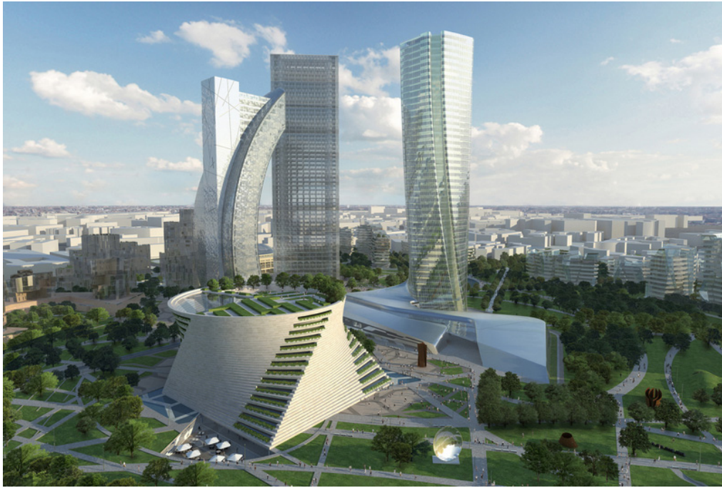
Σχ. 4.Μιλάνο. Το νέο επιχειρηματικό επίκεντρο CityLife .

(2) Τα 'επίκεντρα υψηλού πολιτισμού' αντιστοιχούν σε χωρικές συγκεντρώσεις πολιτιστικών δραστηριοτήτων (π.χ μουσεία, θέατρα, όπερες, αίθουσες συναυλιών, συνεδριακά κέντρα) ενώ οι συμπληρωματικές λειτουργίες περιλαμβάνουν βιβλιοπωλεία, καφετέριες και εστιατόρια (βλ. Mommas 2004). Είναι συνήθως προϊόντα εν μέρει αστικής ανάπλασης ιστορικών πυρήνων (urban renewal) και εν μέρει αστικής αναδόμησης με νέες κατασκευές. Η χωρική μορφολογία είναι μικτή ενσωματώνοντας την αρχιτεκτονική κληρονομιά με τον καινοτόμο σχεδιασμό του χώρου (βλ. ως παραδείγματα, τη Συνοικία Μουσείων στη Βιέννη, τη Συνοικία Μουσείων στο Ρότερνταμ, τη Συνοικία Μουσείων στη Χάγη, την Πόλη των Τεχνών και των Επιστημών στη Βαλένθια). (Σχ.5)