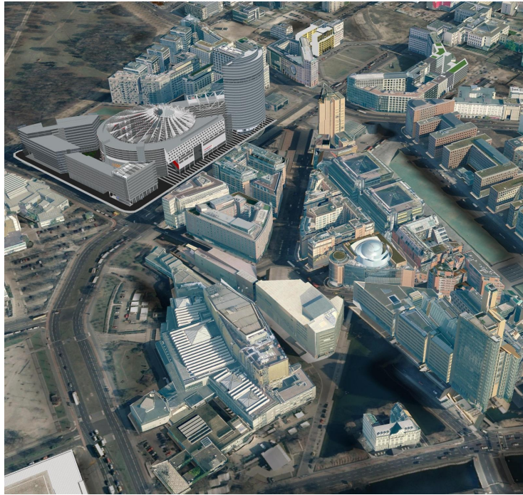
Σχ. 1. Βερολίνο. Το νέο επιχειρηματικό επίκεντρο Potsdamer Platz. http://www.3d-stadtmodell-berlin.de/imperia/md/images/3d/luftbild_potspla.jpg