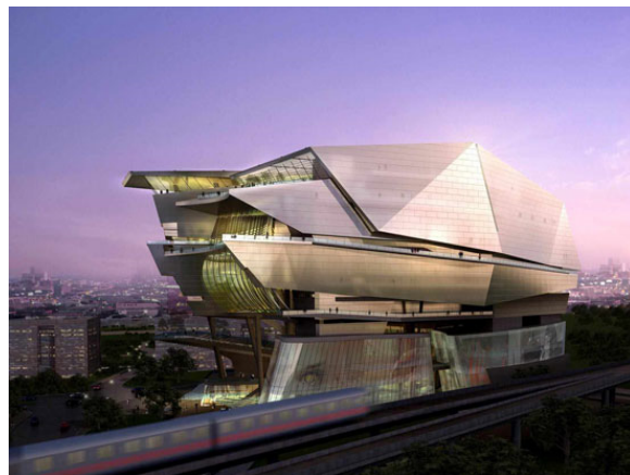
Σχ. 2 και 3. Σιγκαπούρη. Το νέο επιχειρηματικό επίκεντρο στην περιοχή One North.

Σχ. 2: 'Fusionopolis', συγκρότημα κτηρίων του αρχιτέκτονα Kisho Kurokawa