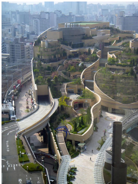
Σχ. 15.: Οσάκα, Ιαπωνία. Το Namba Park και 'υπόγειο' εμπορικό κέντρο (2003). Σχεδιασμένο από τον Jon Jerde.