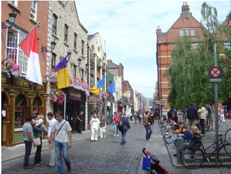
Σχ.6. Δουβλίνο, ιστορικό κέντρο. Το επίκεντρο δημοφιλούς ψυχαγωγίας Temple Bar.