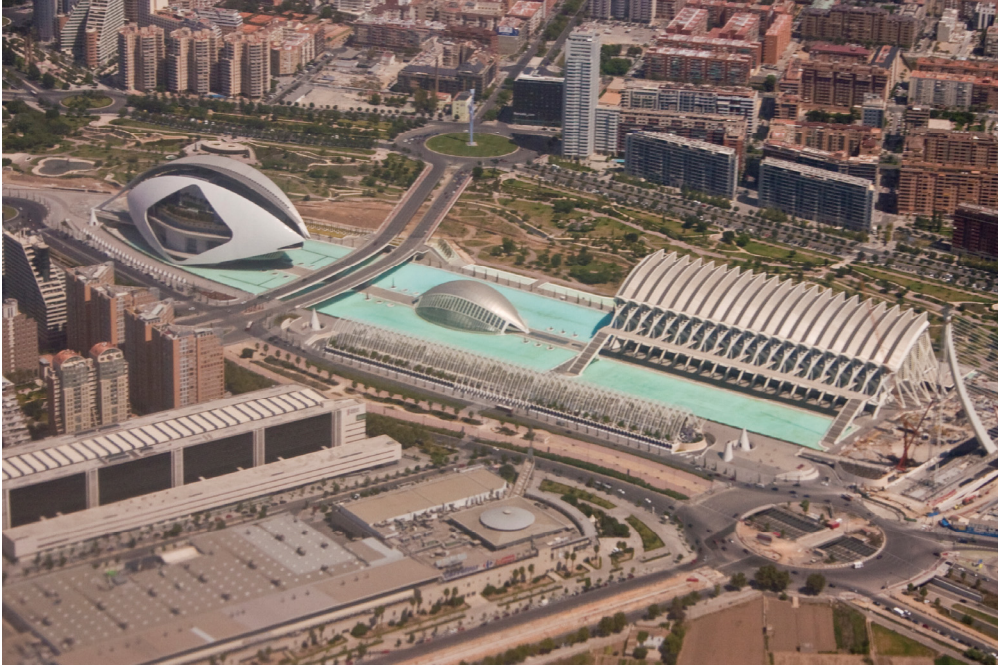
Σχ. 5. Βαλένθια. Η Πόλη των Τεχνών και των Επιστημών.