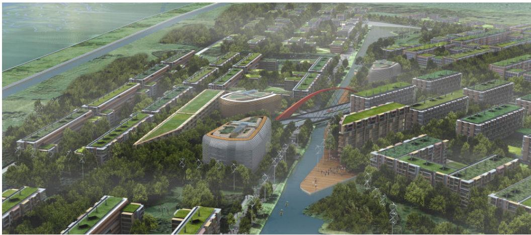
Σχ. 14. Εικόνα της μακέτας της 'πράσινης πόλης' Dongtan στην Κίνα. Σχεδιασμός από την εταιρεία Agur (υπό κατασκευή).

της εκμετάλλευσης των ανανεώσιμων πηγών ενέργειας, παρέχουν νέες δυνατότητες στο βιώσιμο σχεδιασμό των πόλεων. Με μία έννοια, οι νέες τεχνολογικές εξελίξεις σ' αυτούς τους τομείς αποτελούν αντίβαρο για άλλες αρνητικές συνέπειες των νέων τεχνολογιών. Δηλαδή, οι νέες τεχνολογίες ενισχύουν την αστική διάχυση και κατά συνέπεια, λειτουργούν ενάντια στη βιώσιμη ανάπτυξη των πόλεων. Όμως ταυτόχρονα, με τις νέες κατασκευαστικές τεχνικές και υλικά μπορούν να μετριαστούν οι αρνητικές συνέπειες και να κάνουμε σήμερα πραγματικότητα την 'πράσινη αρχιτεκτονική', τον 'πράσινο αστικό σχεδιασμό' και την 'πράσινη ανάπτυξη' των πόλεων (σχ 14, 15).