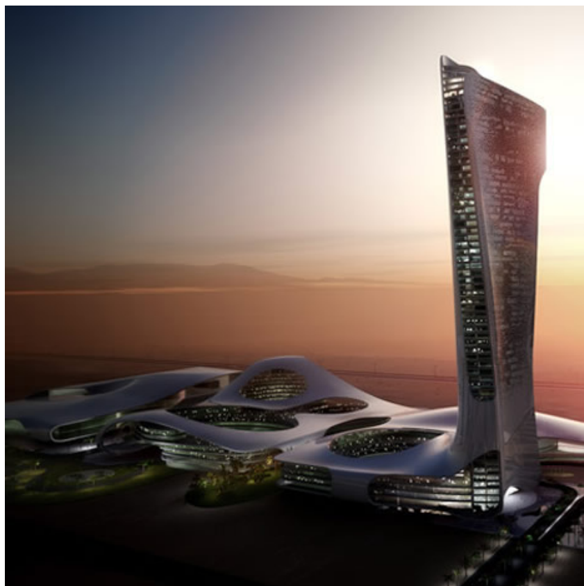
Σχ. 13 Η νέα είσοδος στο Εμιράτο Ras Al Khaimah μέσα στην έρημο (υπό κατασκευή), σχεδιασμένη από το πολυεθνικό αρχιτεκτονικό γραφείο Snøhetta.