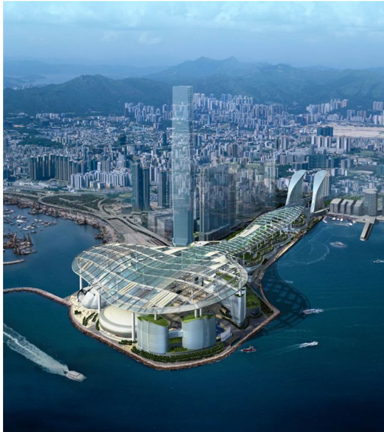
Σχ.8. Χονγκ Κονγκ. Το νέο παραλιακό επίκεντρο πολιτισμού και ελεύθερου χρόνου στο West Kowloon. 2004 Architects: HOK, Cesar Pelli & Associates, Kenzo Tange Associates.