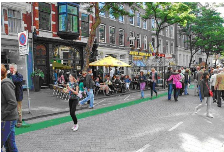
Σχ.7 Ρόττερταμ, ιστορικό κέντρο. Το επίκεντρο δημοφιλούς ψυχαγωγίας Witte de Withstraat.