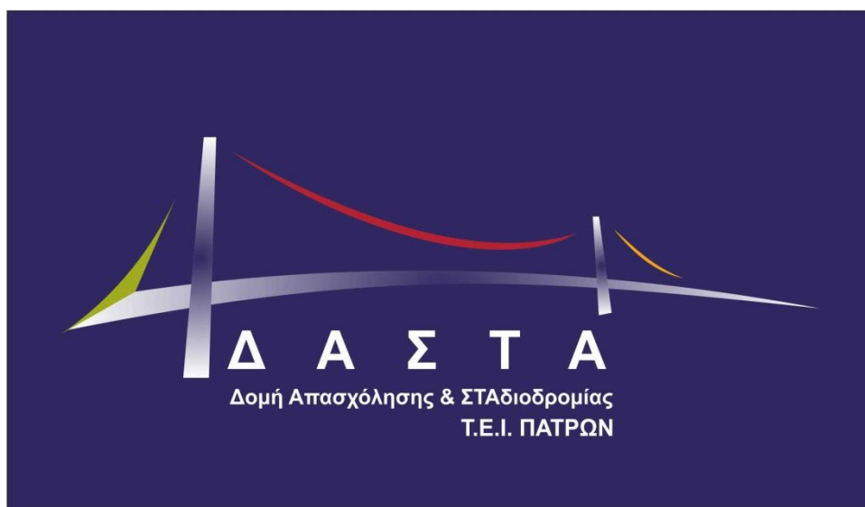
Εικόνα 1. Λογότυπο ΔΑΣΤΑ ΤΕΙ Πατρών

Λόγω της πρώιμης φάσης του έργου, δεν πραγματοποιήθηκε κάποια μεγάλη ενημερωτική εκδήλωση, ούτε κάποια ημερίδα καινοτομίας ή σχετικός φοιτητικός διαγωνισμός. Εξαιτίας του γεγονότος ότι οι δύο από τις τέσσερις Πράξεις (ΓΔ και ΜΟΚΕ) δεν έχουν ξεκινήσει ακόμα, τα παραπάνω κρίθηκαν μη αποτελεσματικά στην παρούσα φάση. Ωστόσο, έχει γίνει σχετικός προγραμματισμός για την δεύτερη περίοδο του έργου.